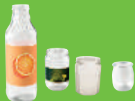
Pots et bocaux en verre