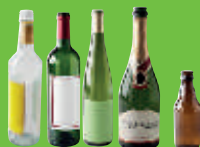
Bouteilles et flacons en verre