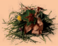
Déchets de jardin