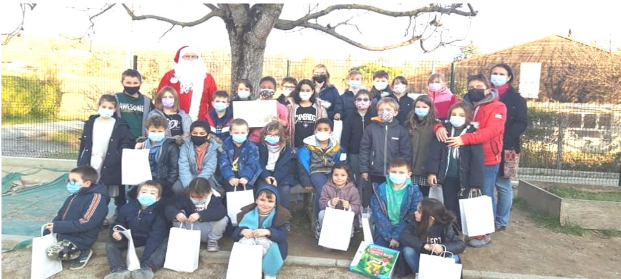
La visite du Père Noël à l'école

Nous vous donnons rendez-vous au printemps pour une nouvelle vente à emporter ainsi que le 17 juin pour la fête de la musique !