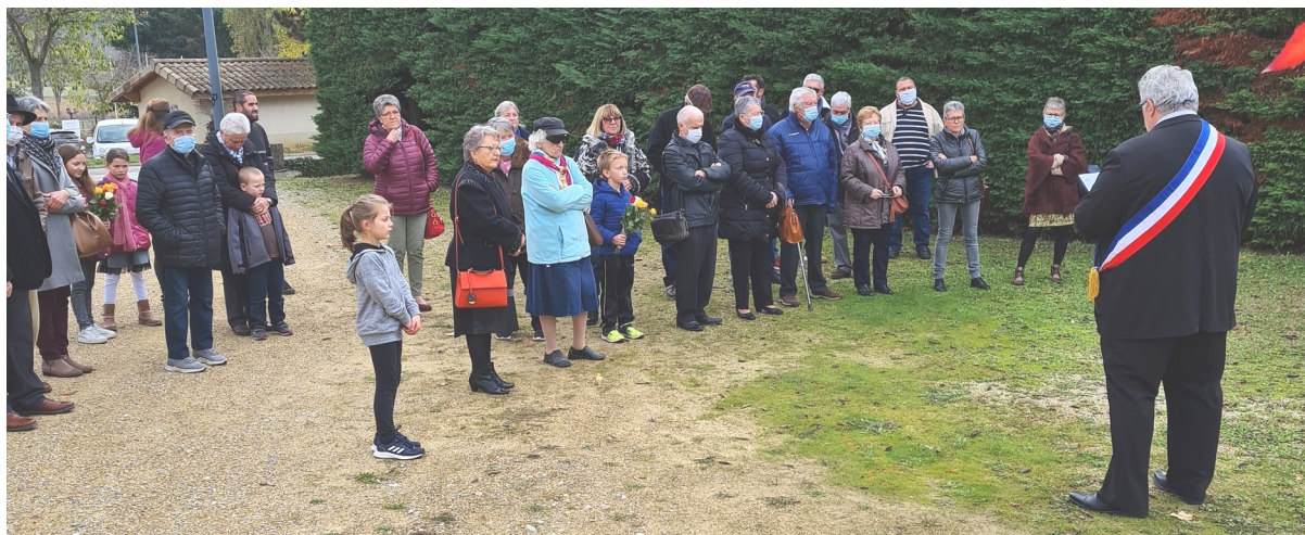
Recueillement lors de la cérémonie