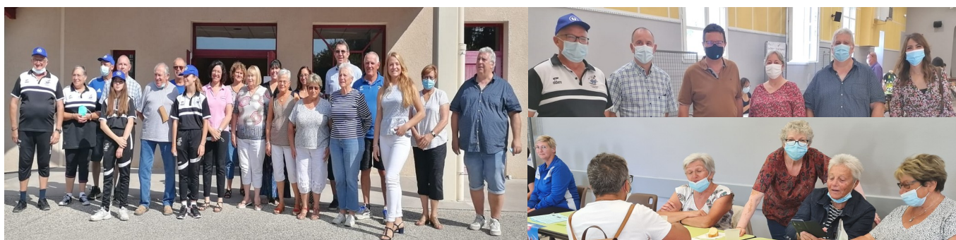
Exposants et élus présents au forum

Le samedi 4 septembre 2021, pas moins de 14 associations des villages de Parnans, Châtillon-saint-Jean et Triors étaient réunies, dans la salle polyvalente de Triors, pour proposer au public nombreux venu leur rendre visite des activités comme la danse, la pétanque, le théâtre, la musique.... Des démonstrations de pétanque étaient organisées pour donner aux plus jeunes le goût de cette activité. On notait la présence de représentants des clubs des Anciens, très impliqués.