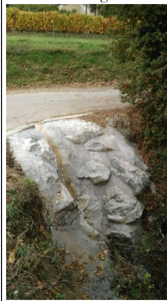
Renforcement du déversoir

La refonte du parking du cimetière, les bas côtés de la montée du Pavé, l'enrochement du déversoir dans le virage de la route des Beugnets, les revêtements des rues Planchâtel Nord et Sud et du chemin des Buis, l'entretien des chemins des Baumes, de la Fontanille ainsi que l'impasse du Béal et le renforcement du fossé à l'entrée de Triors.