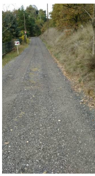
Chemin de Fontanille