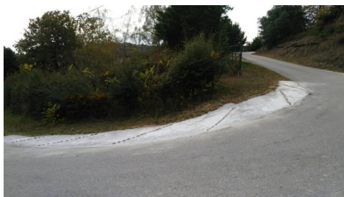
Montée du Pavé