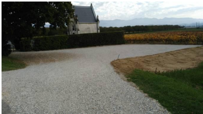
Le parking du cimetière