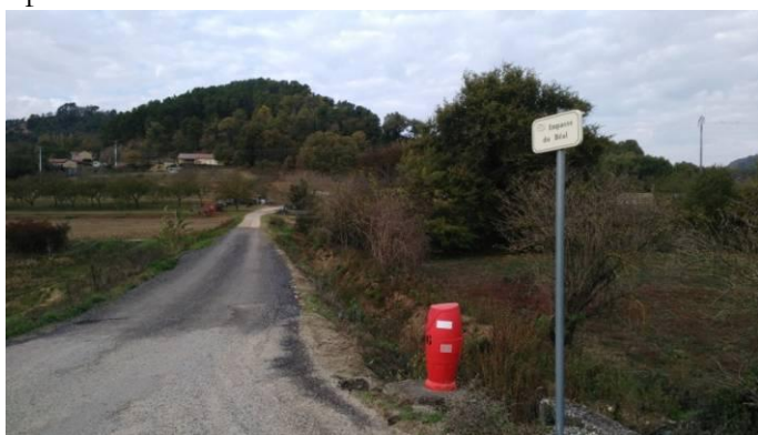
Impasse du Béal