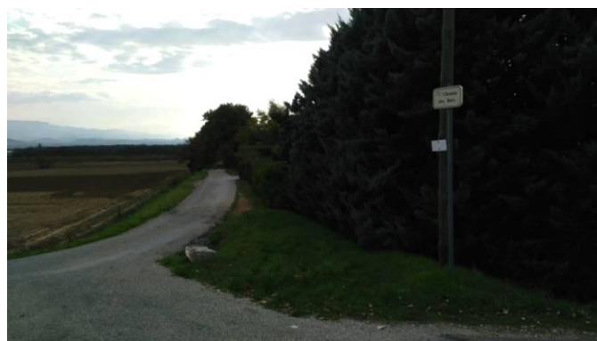
Chemin des buis