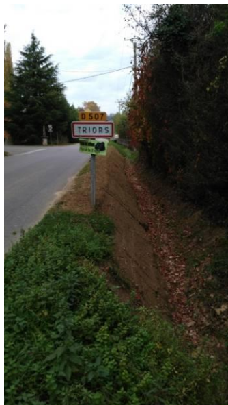
Renforcement du fossé